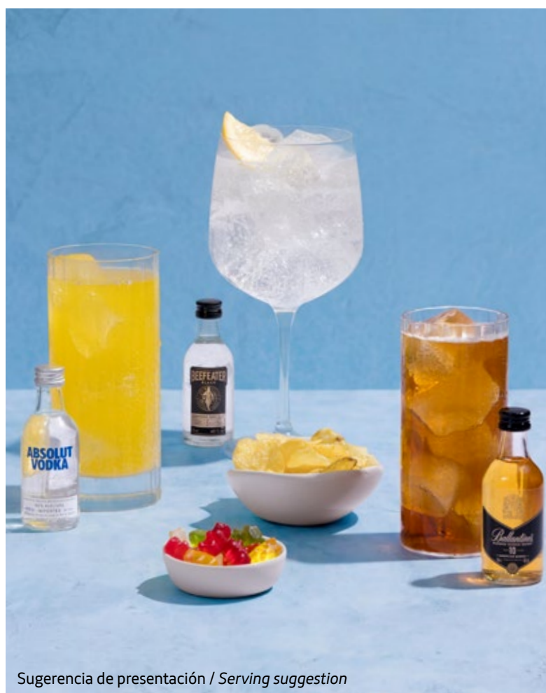
Sugerencia de presentación / Serving suggestion