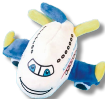
AVIÓN DE PELUCHE SOLIDARIO* _____ 8,00€ Solidarity soft toy plane*

* El total recaudado se destinará íntegramente a proyectos solidarios de Aviación Sin Fronteras. All proceeds will be donated to charity projects of Aviation Without Borders.